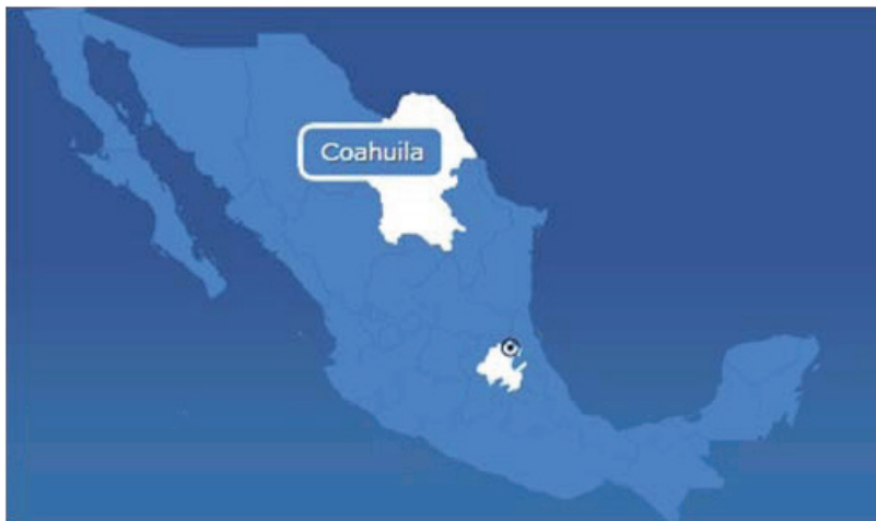
Estado de Hidalgo (centro) con San Felipe Orizatlán marcado por el círculo. Mapa: http://www.en.db-city.com/Mexico--Hidalgo--Orizatlán .